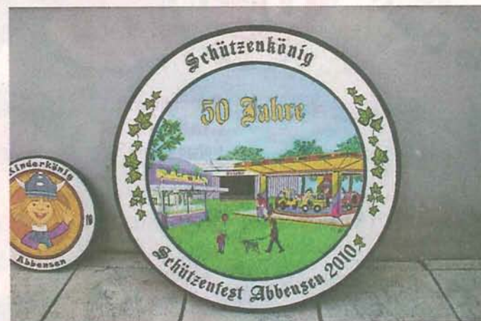
Auf der Jubiläumsscheibe zum 50. Schützenfest ist eine kunterbunte Jahrmarkt-Szene zu sehen. hh

Vor 16 Jahren hat die Autodidaktin mit dem Malen begonnen, vor vier Jahren machte sie es zu ihrem Hauptberuf. Damit habe sie lange gezögert, sagt sie. „Meine Eltern haben gesagt: Mädchen, davon kannst du nicht leben. Und ich bin eigentlich sehr bodenständig.“ Heute gibt sie Malunterricht, zeichnet Porträts, stellt Bilder aus – und ist stolz, wenn sie „ihre“ Scheiben im Dorf entdeckt. sur